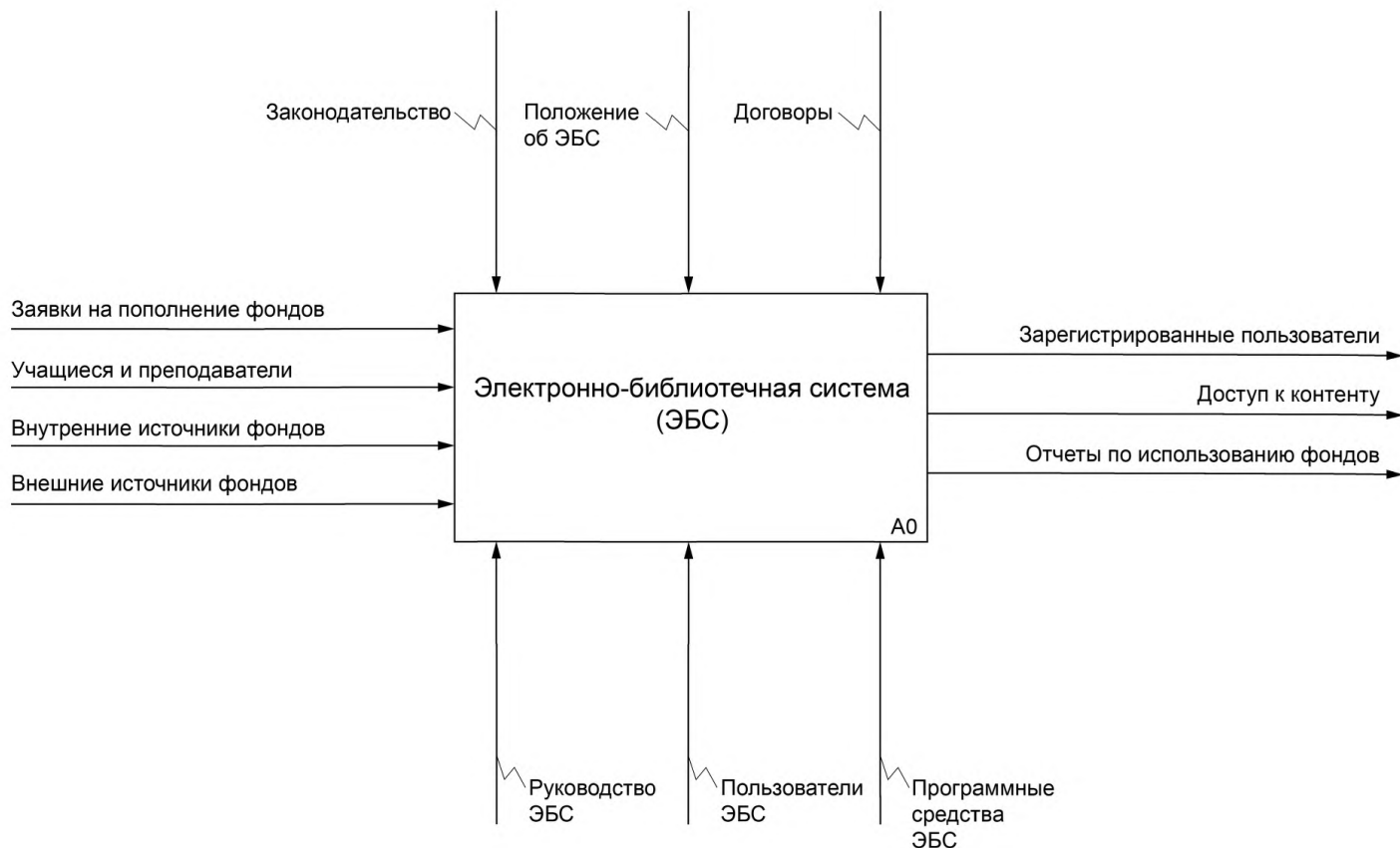
Рисунок А.1 — Контекстная диаграмма